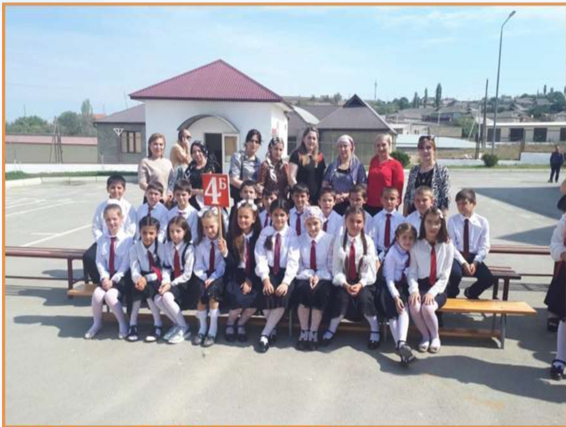
СОШ №5 г.Буйнакск