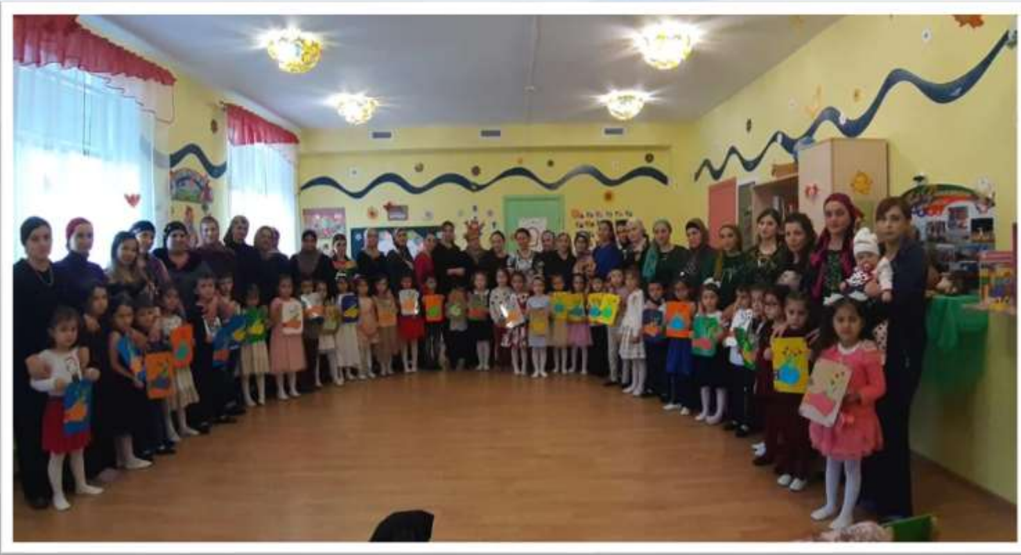
Конкурс для мам «Лучшая прическа»