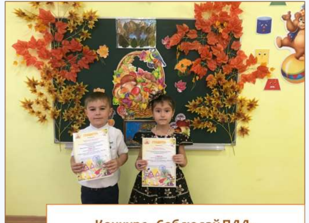
Конкурс «Соблюдай ПДД»