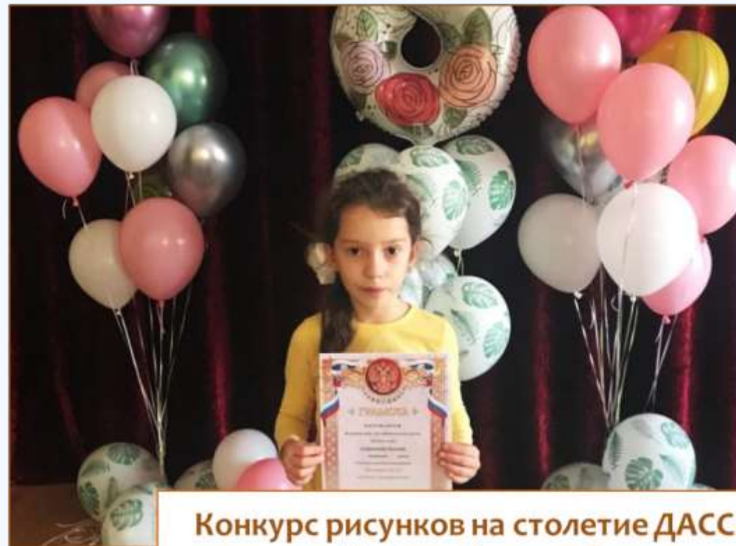
Конкурс рисунков на столетие ДАССР «Край мой родной»