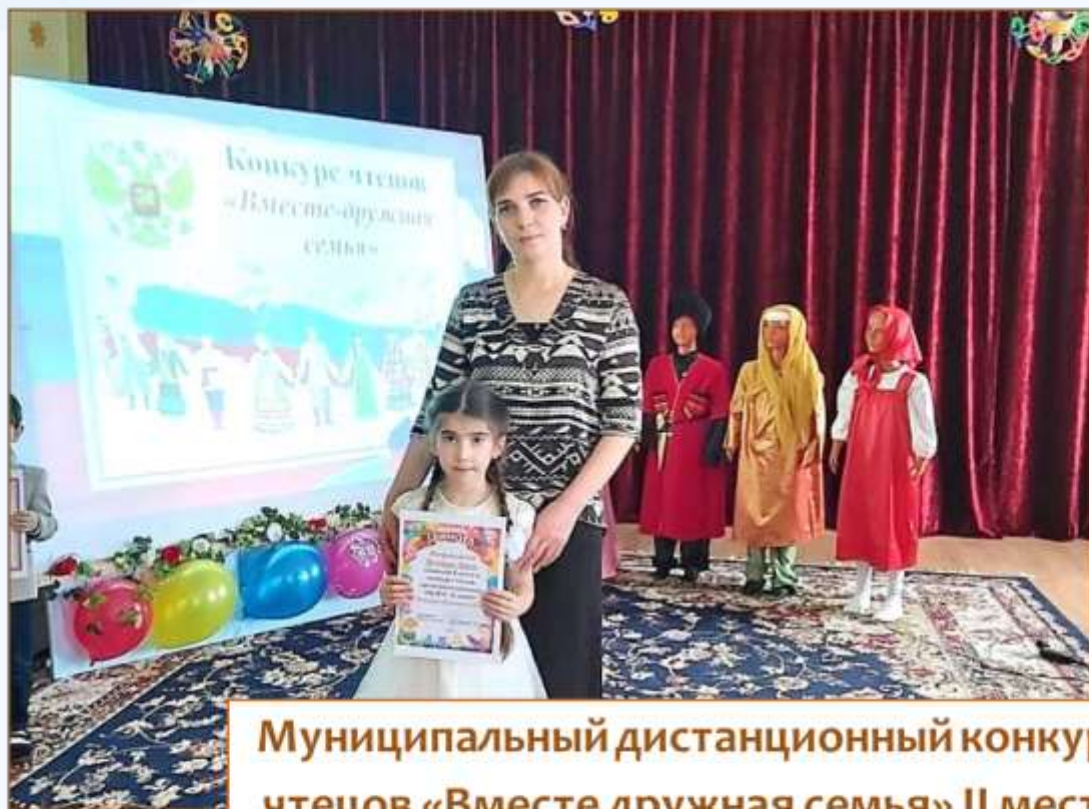
Муниципальный дистанционный конкурс чтецов «Вместе дружная семья» II место