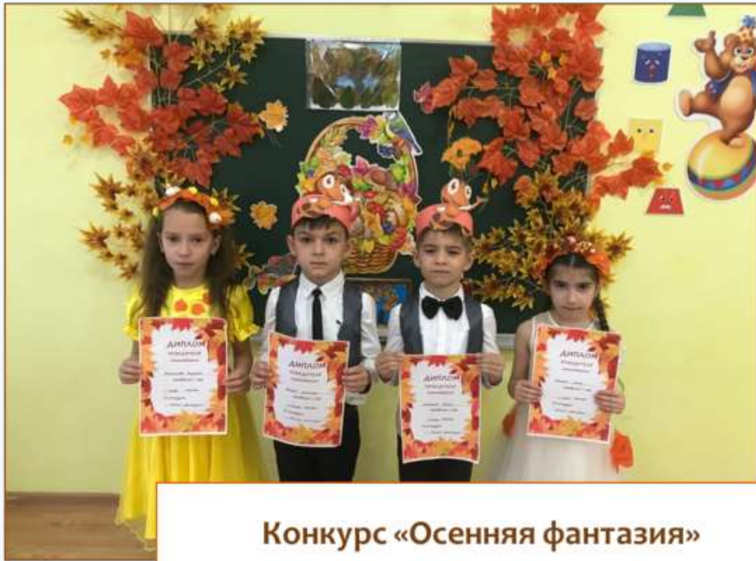
Конкурс «Осенняя фантазия»